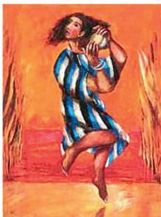
Sieger Köder: Die tanzende Mirjam (Ausschnitt aus Misereor Hungertuch 1996)